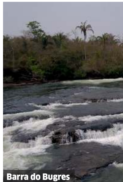
Barra do Bugres