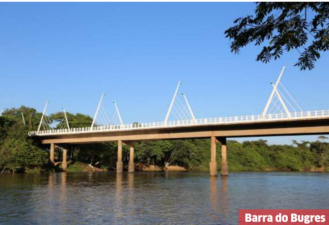
Barra do Bugres