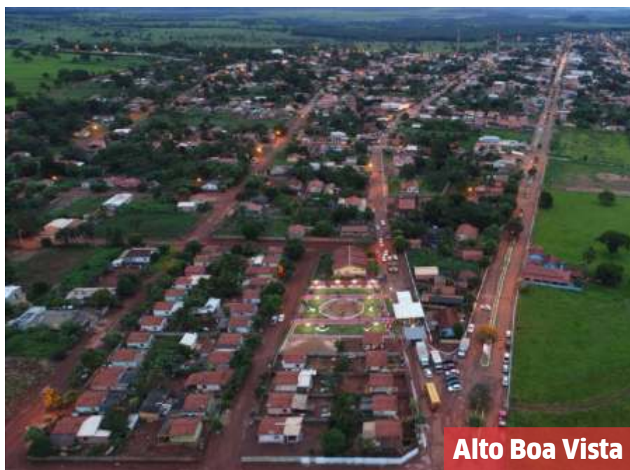
Alto Boa Vista

I ITANHANGÁ Itanhangá, localizado na região centro-oeste de Mato Grosso, comemora 25 anos no dia 3 de abril. O município, distante cerca de 453 km de Cuiabá, registrou uma população de 7.539 habitantes no Censo de 2022, conforme dados do Instituto Brasileiro de Geografia e Estatística (IBGE). Sua economia é fortemente baseada na agricultura, setor que impulsiona o desenvolvimento local.