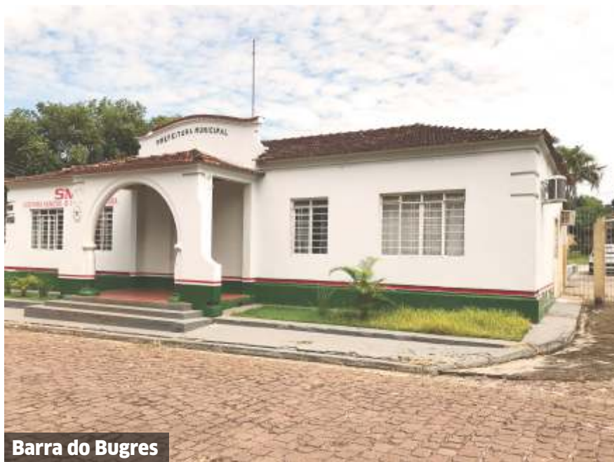
Barra do Bugres

de álcool, biodiesel, açúcar e eletricidade, enquanto o Frigorífico Naturafriq realiza o abate de cerca de 700 reses por dia. O setor industrial também inclui fábricas de ração animal, serrarias, marcenarias, indústria moveleira e cerâmica, além de um comércio local em constante crescimento.