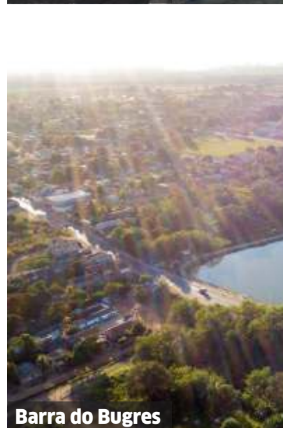
Barra do Bugres