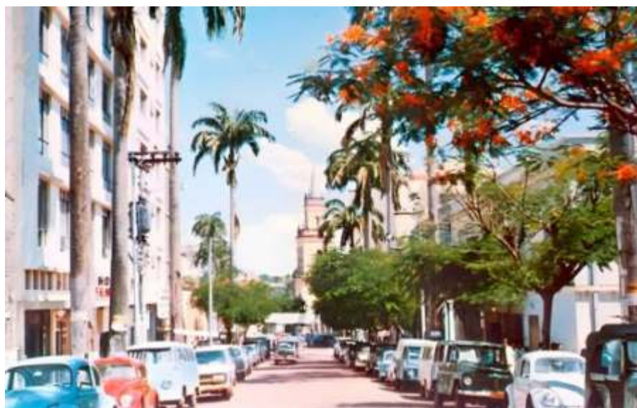
: Avenida Getúlio Vargas na década de 60

Cuiabá também foi o berço de figuras históricas importantes, como Miguel Sutil, bandeirante responsável pela descoberta das minas de ouro, e Fernando Corrêa da Costa,