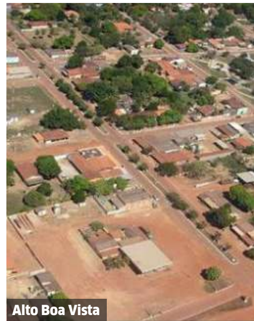
Alto Boa Vista

Com a criação da Colônia Agrícola em 1942, o povoado se fortaleceu e, em 29 de outubro de 1952, foram designados 1.800