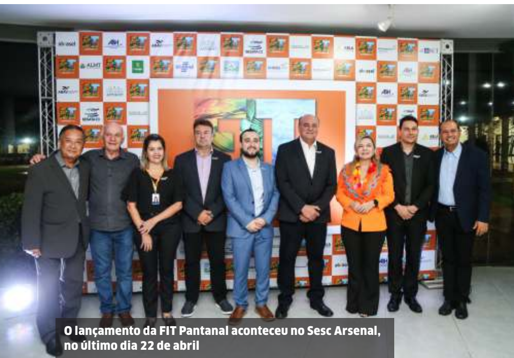
O lançamento da FIT Pantanal aconteceu no Sesc Arsenal, no último dia 22 de abril