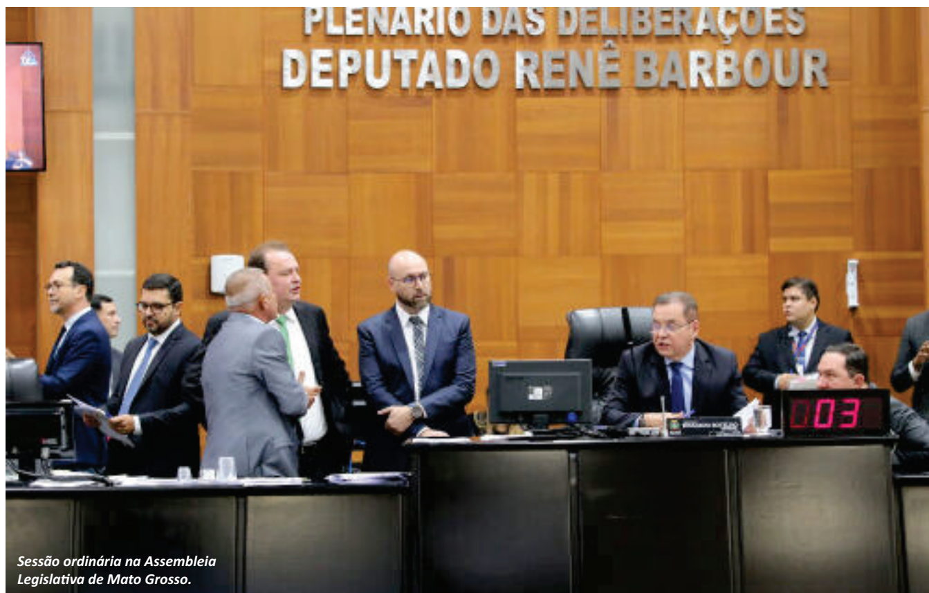
Sessão ordinária na Assembleia Legislativa de Mato Grosso.