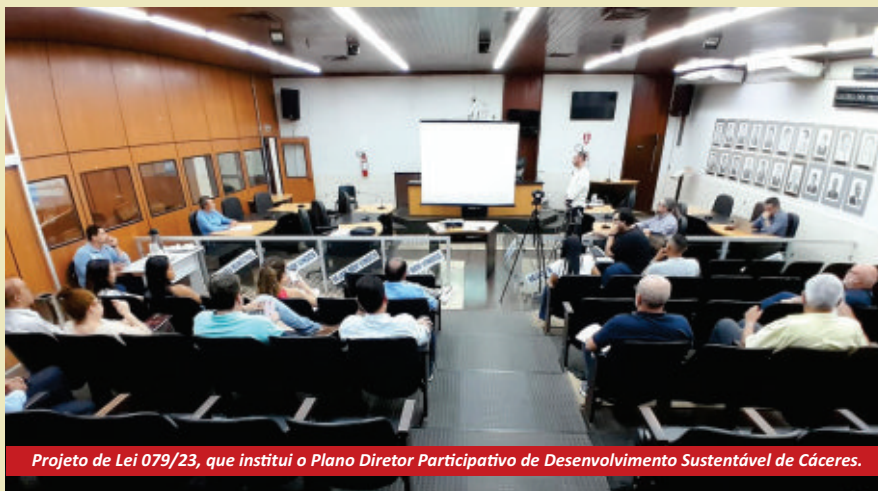
Projeto de Lei 079/23, que institui o Plano Diretor Participativo de Desenvolvimento Sustentável de Cáceres.