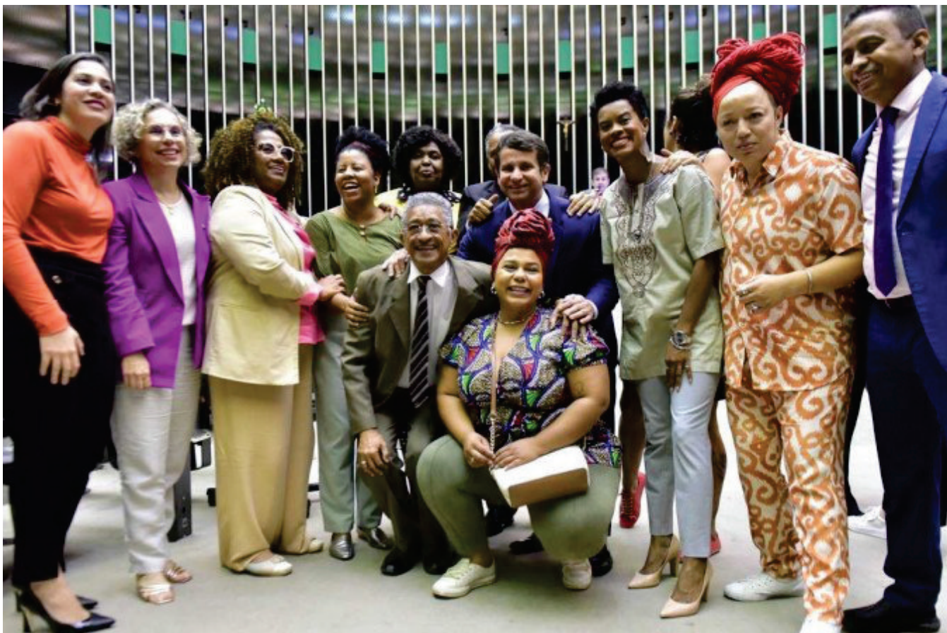
Bancada Negra na Câmara.