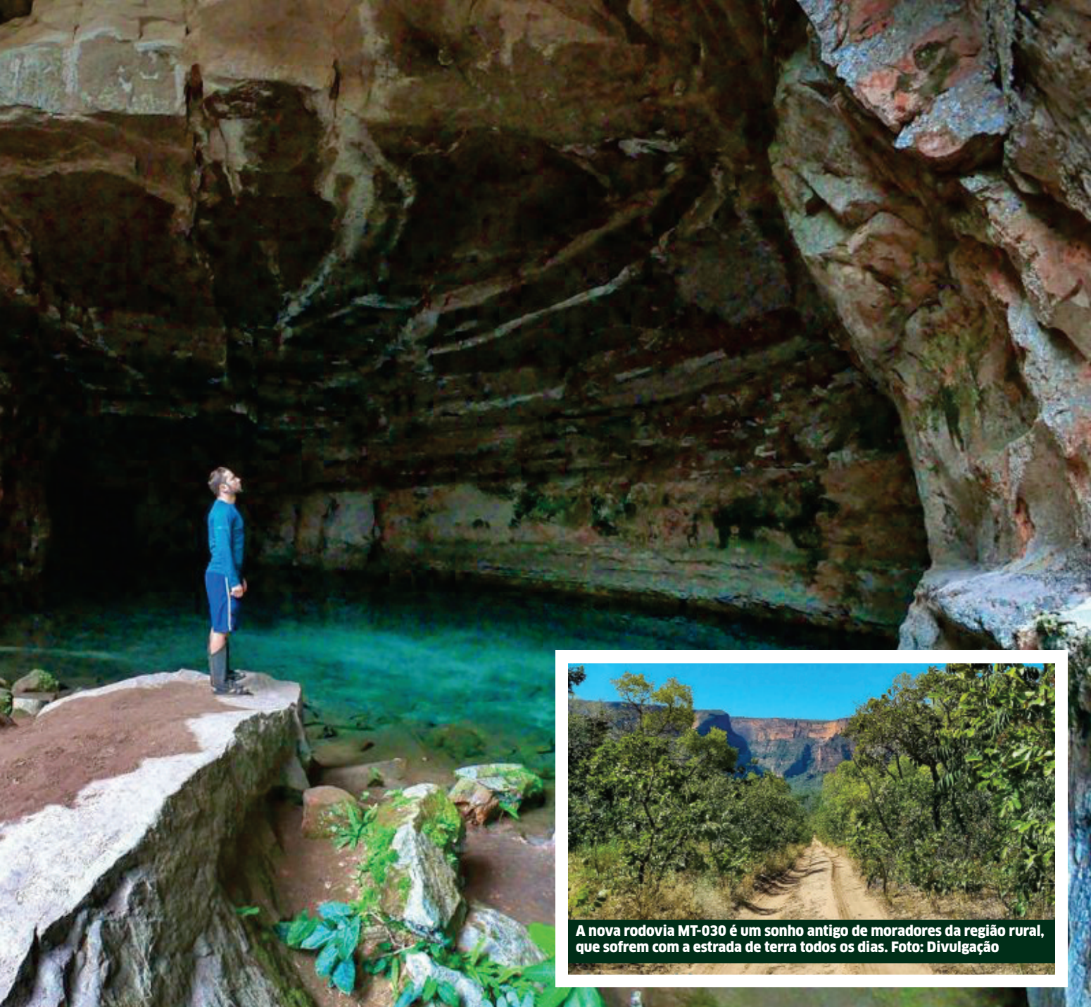
A nova rodovia MT-030 é um sonho antigo de moradores da região rural, que sofrem com a estrada de terra todos os dias.

ferro”. A Sinfra (Secretaria de Estado de Infraestrutura e Logística) assinou a ordem de serviço para o início das obras de asfaltamento da MT-030, a estrada da ponte de ferro, em Cuiabá.