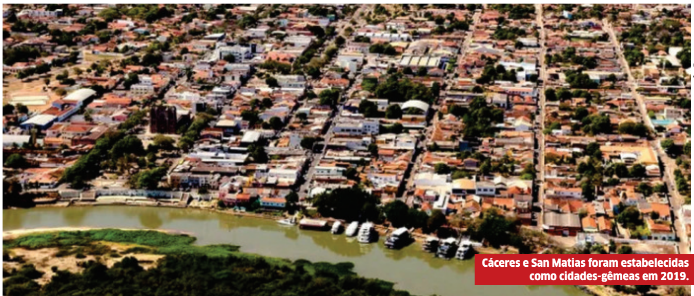
Cáceres e San Matias foram estabelecidas como cidades-gêmeas em 2019.

O Ministério da Integração Nacional define como cidades-gêmeas aqueles municípios situados na linha de fronteira, seca ou fluvial, integrada ou não por obras de infraestrutura, que representam grande potencial de integração econômica e cultural.