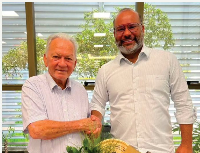
Niraj em números