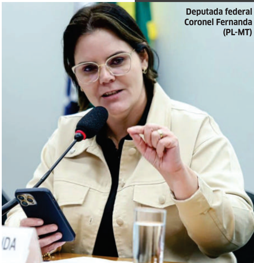
Deputada federal Coronel Fernanda (PL-MT)

“A repactuação de dívidas rurais se constitui em um importante instrumento de reorganização financeira para o produtor, porém, as alterações nos encargos financeiros das operações de crédito, muitas vezes, dificultam a quitação dessas parcelas.