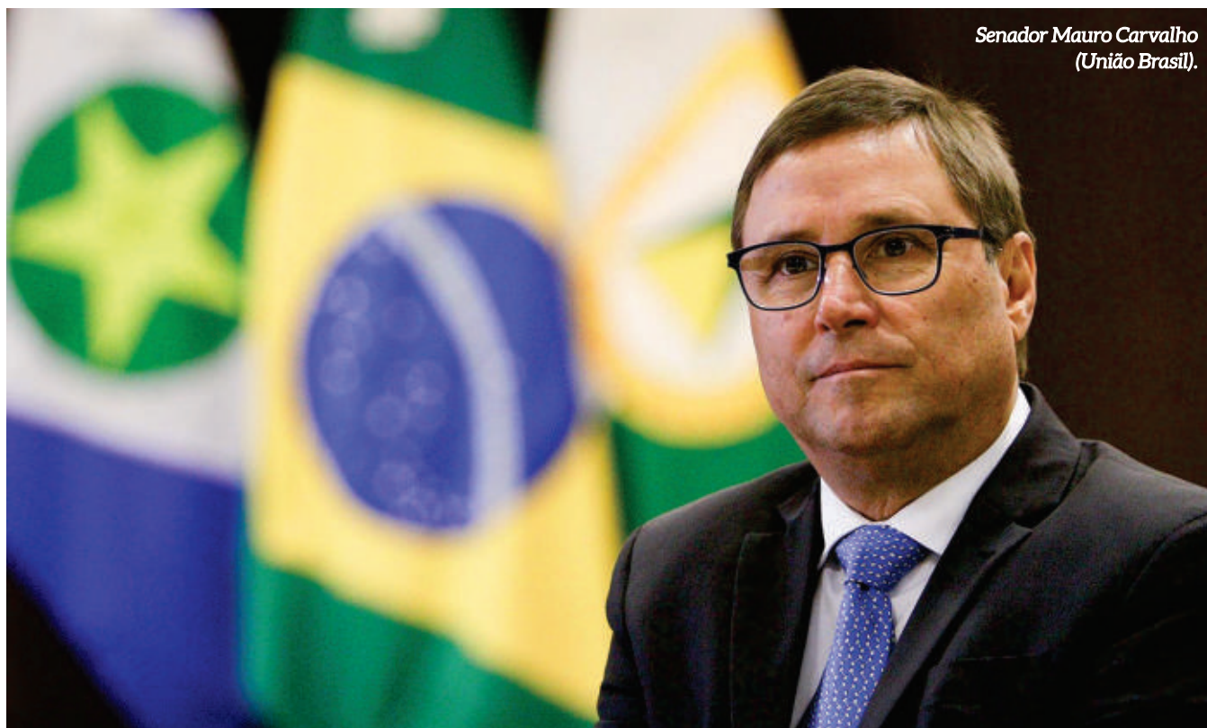
Senador Mauro Carvalho (União Brasil).

Senador Mauro Carvalho Junior fala sobre as ações que estão sendo implementadas em Mato Grosso