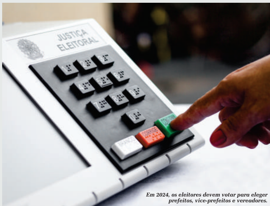
Em 2024, os eleitores devem votar para eleger prefeitos, vice-prefeitos e vereadores.

O G1 fez um levantamento considerando o aumento populacional de cada município. Das 141 cidades de Mato Grosso, 91 tiveram crescimento no número de habitantes. No entanto, apenas 20 cresceram o suficiente para pedir o