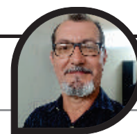
Por Denilson Paredes