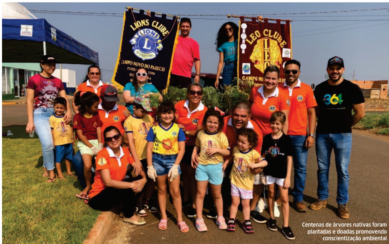
Centenas de árvores nativas foram plantadas e doadas promovendo conscientização ambiental