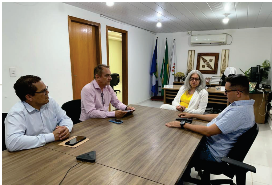
O novo campus da Unemat em Sapezal já tem o curso de Ciências Contábeis confirmado