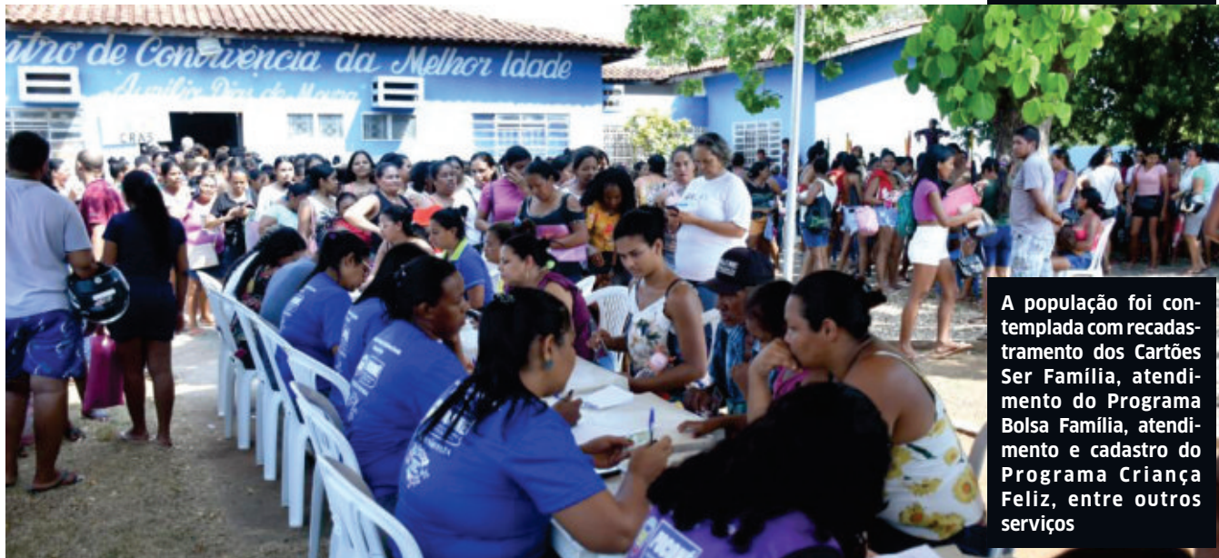
A população foi contemplada com recadastramento dos Cartões Ser Família, atendimento do Programa Bolsa Família, atendimento e cadastro do Programa Criança Feliz, entre outros serviços