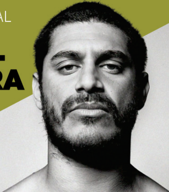
Criolo | Cantor brasileiro

A capital cuiabana está em plena agitação com a terceira edição do festival que reúne música para todos os estilos na Arena Pantanal. Confira essa e outras programações!