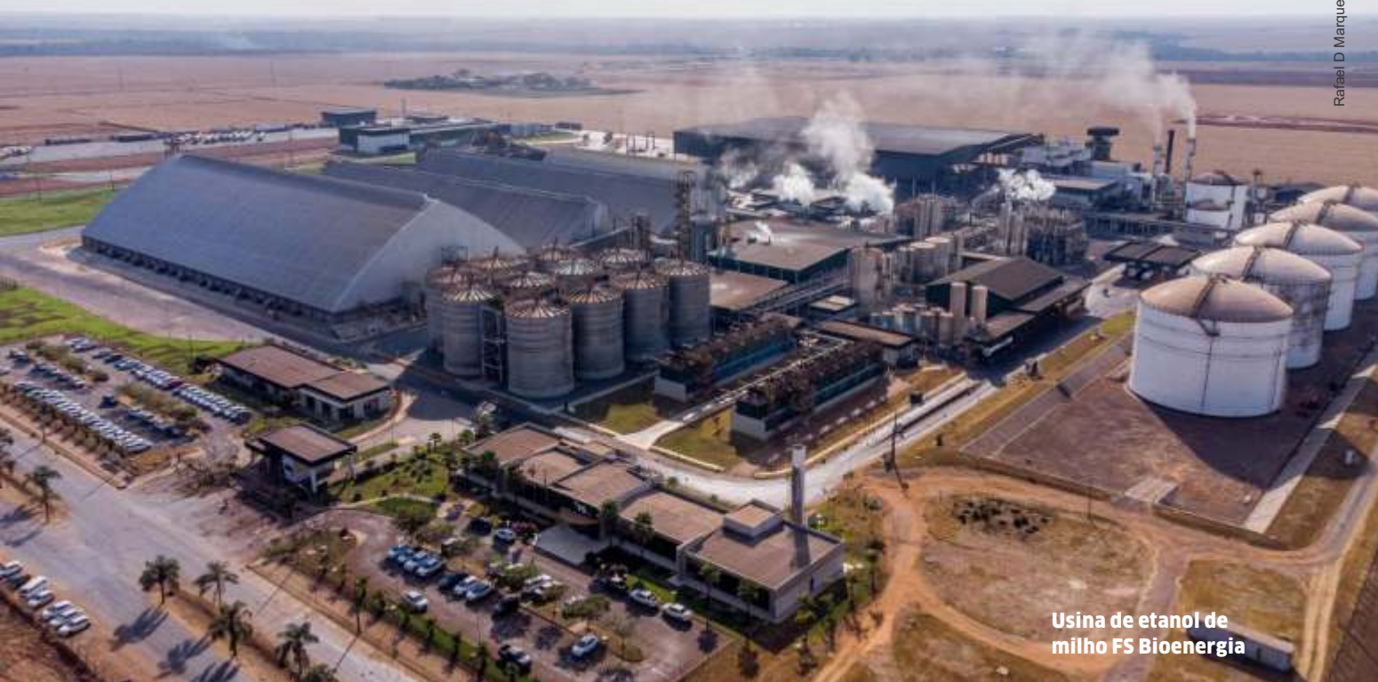
Usina de etanol de milho FS Bioenergia

que é de atribuição estadual, já estamos fazendo.