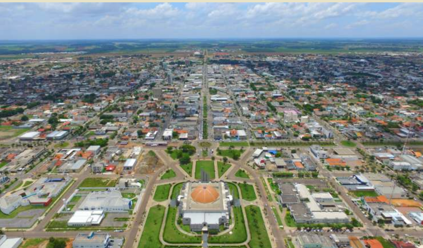
Sinop é uma cidade com grande potencial na produção de soja, milho e algodão, e também conta com um polo industrial diversificado

melhorando cada vez mais. Não estou menosprezando qualquer outra cidade, mas, hoje, se me convidarem para morar em outro lugar, eu não aceito. Não saio de Sinop! Essa é a cidade que mais cresce no Brasil e que tem proporcionado uma condição de vida invejável ao nosso municípe.