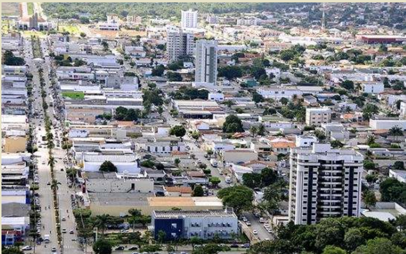
Urbanismo planejado: o traçado da cidade é regular e suas quadras são interligadas por mais de 400 km de ruas e avenidas, com áreas residenciais limitadas por avenidas com até 50 metros de largura

Clube. Neste último, implantamos duas escolas, sendo uma de educação infantil e outra de ensino fundamental. Há outras três em construção e que queremos entregar no começo do ano que vem, para atender a população do Residencial Nico Baracat, nos Vilas [região da cidade que agrega vários bairros e uma grande população] e Terra Rica. As escolas inauguradas foram feitas no sistema modular e foram construídas em tempo recorde e já estão em funcionamento e, as demais, estamos seguindo o sistema de construção. Nós temos esse compromisso com a sociedade. Temos crianças fora da sala de aula e queremos mudar essa realidade.