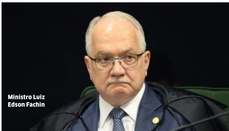
Ministro Luiz Edson Fachin

Barroso foi eleito por dez votos. Atualmente, vice-presidente do STF, ele será também o presidente do CNJ para o biênio 2023-2025