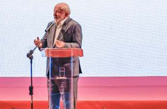
Mauro Mendes, governador do Estado de Mato Grosso