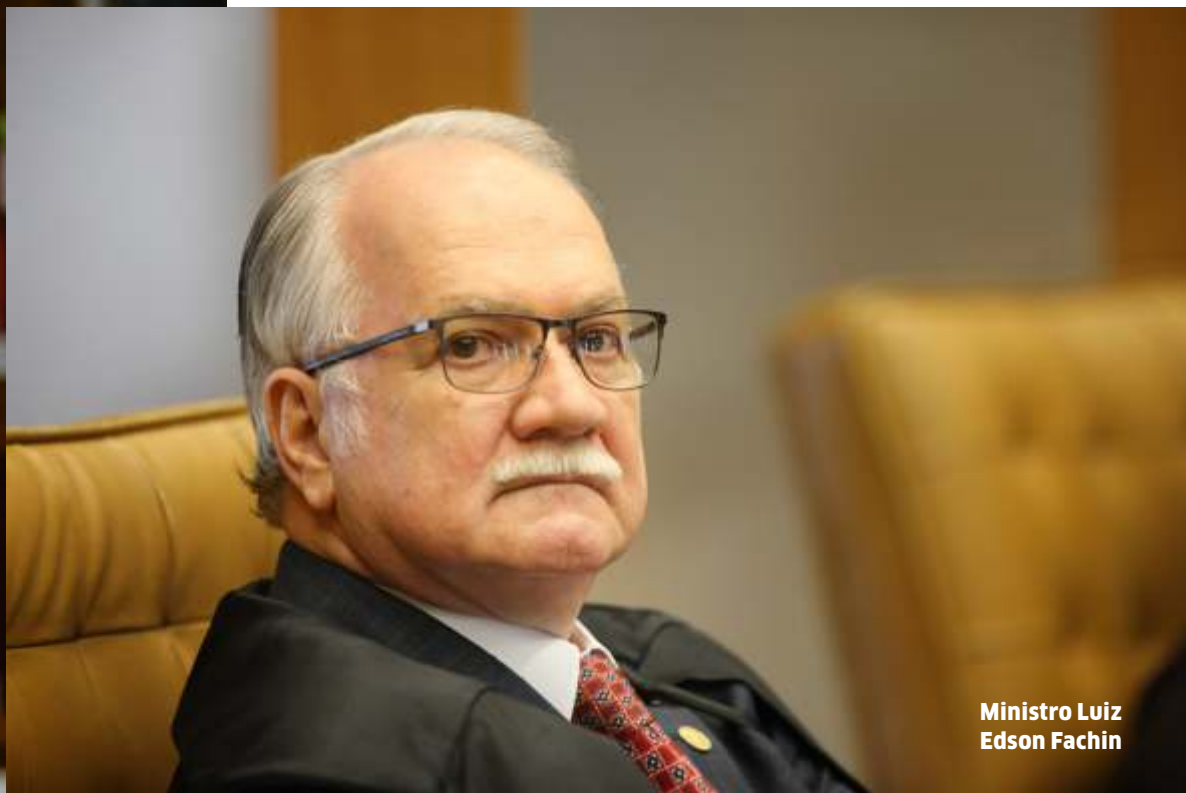
Ministro Luiz Edson Fachin