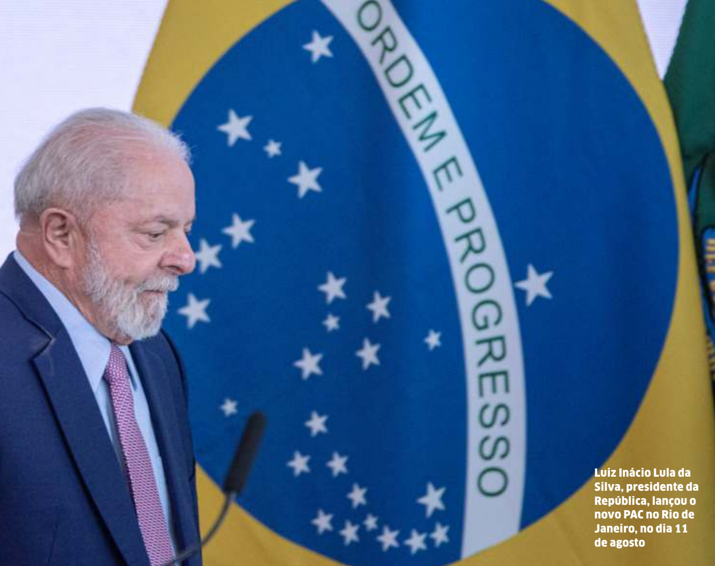
Luiz Inácio Lula da Silva, presidente da República, lançou o novo PAC no Rio de Janeiro, no dia 11 de agosto