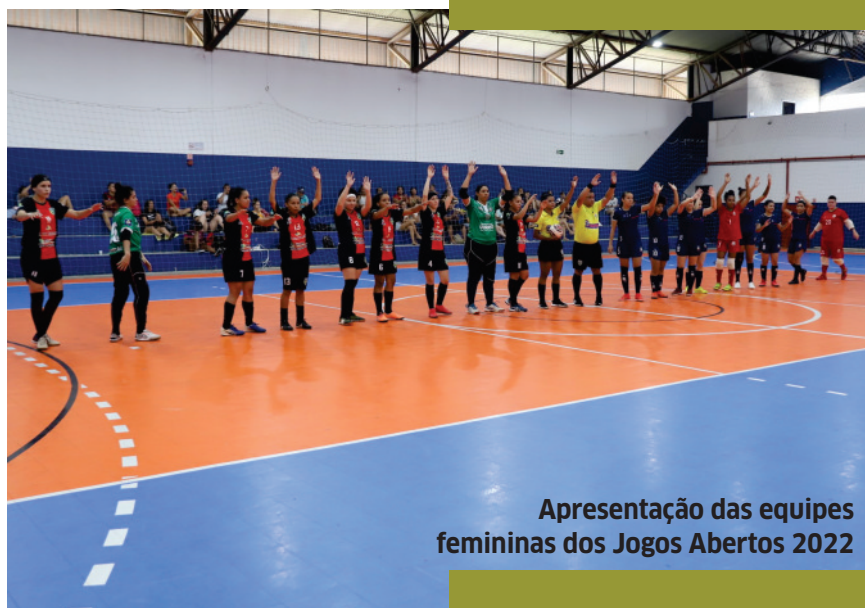
Apresentação das equipes femininas dos Jogos Abertos 2022

A próxima fase regional será realizada em Juara, no período de 05 a 08 de outubro, com disputas das seleções municipais das regiões esportivas Médio Norte e Noroeste. Para essa disputa regional, o prazo de inscrição vai até o dia 25 de setembro.