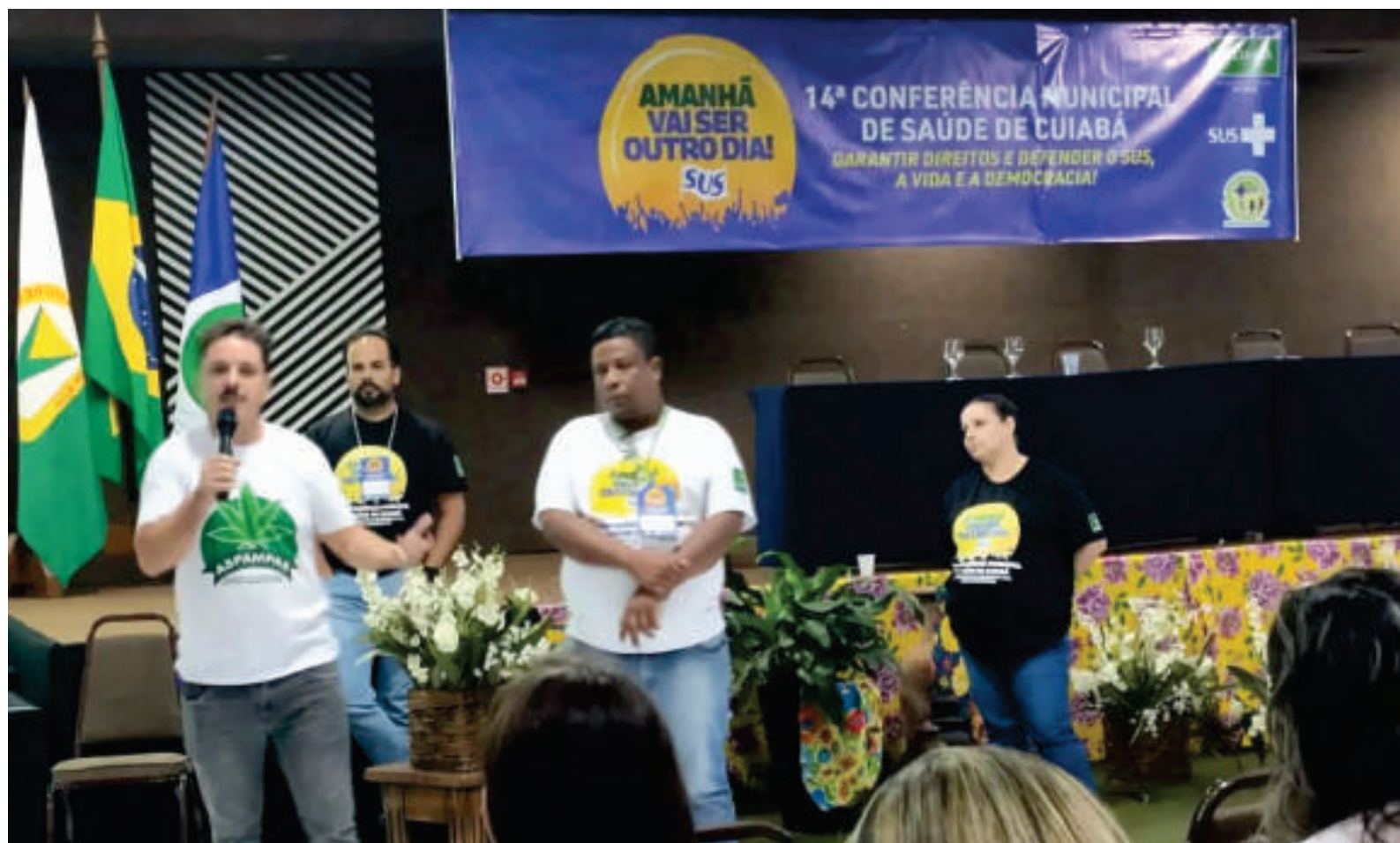
Membros da ASPAMPAS participam da Conferência Municipal de Saúde

um tempo que não fazem mais efeito, isso muitos médicos falam, e também as vezes eles passam a fazer o efeito contrário, ao invés de diminuir a ansiedade, aumenta mais e eu comecei a sentir isso no meu corpo. Foi quando eu comecei a procurar e conheci uma pessoa que usa a cannabis em Cuiabá e ela me ensinou o caminho. Eu achava que ia ser uma coisa muito difícil, mas não foi. A maioria dos óleos que a gente tem aqui no Brasil, não sendo de associação, são importados, então a gente entra no site da Anvisa, preenche um formulário para pedir autorização para importação, que foi o que eu fiz e a maioria faz. Esperei o medicamento chegar, comecei o tratamento e comecei a perceber que eu não sentia mais a necessidade de tomar remédio para dormir, que o meu raciocínio estava ficando melhor, voltei a sentir vontade de trabalhar e meu cérebro começou a funcionar de uma maneira que já tinha bastante tempo que ele não funcionava. Eu fico até emocionada de falar