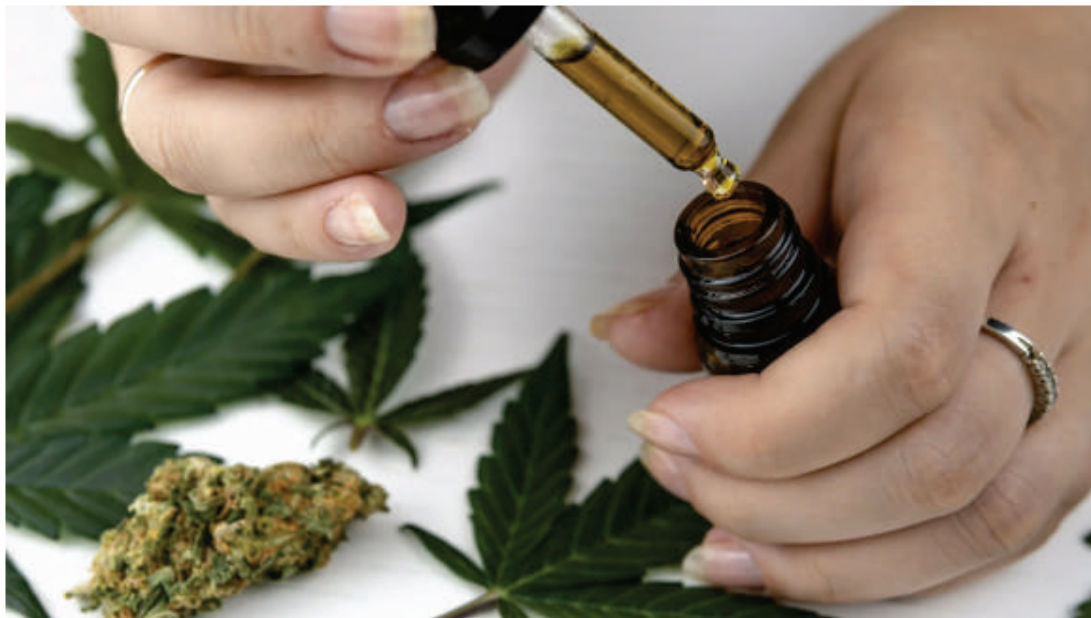
A cannabis medicinal já é legalizada em vários países

Tânia Luz – Nós participamos de um evento aqui em Cuiabá que foi o primeiro, no dia 6 de fevereiro, lá no Hotel Odara. Ali nós tivemos contato e foi o dia que a ASPAMPAS foi criada. Vieram vários profissionais: agrônomos, advogados, médicos. O deputado Wilson também participou e foi discutida a questão do plantio