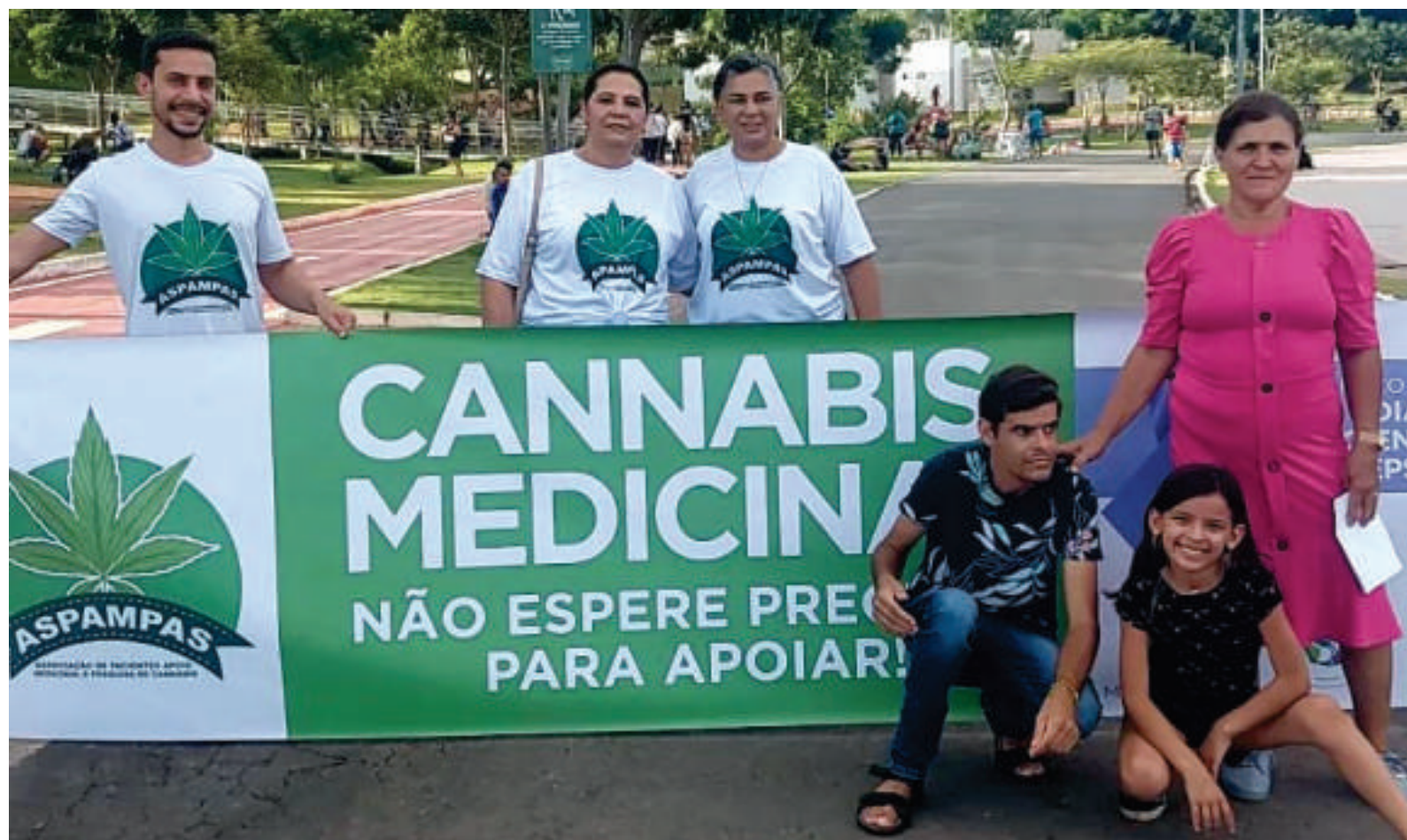
Membros da ASPAMPAS em manifestações em defesa do uso medicinal da cannabis

Jornal do Ônibus - Não temos ainda no país, muito menos no estado e no município, uma lei que possibilita que as pessoas