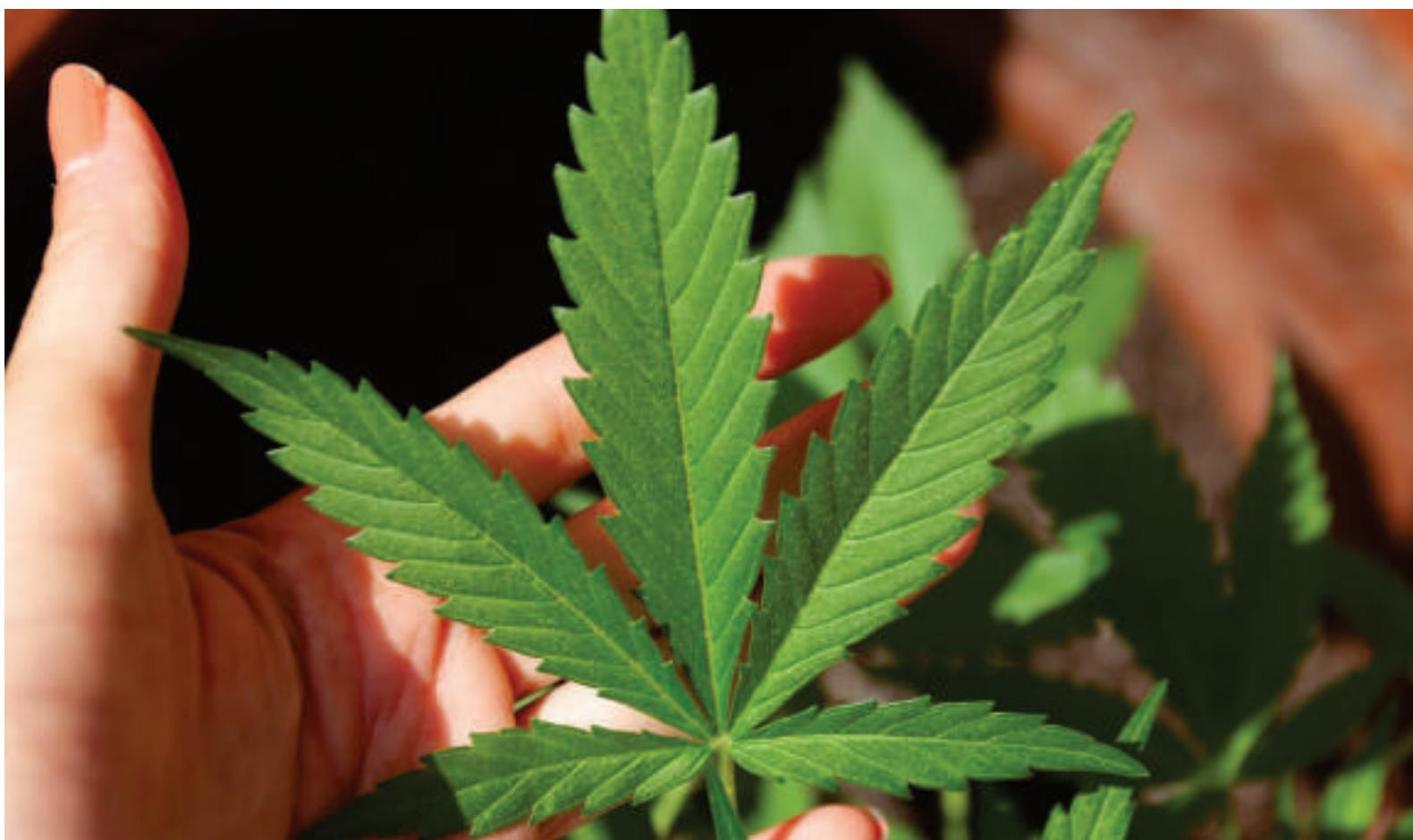
“A cannabis está para a medicina do século 21 o que os antibióticos estiveram para a medicina do século XX”

“A ASPAMPAS nasceu da dificuldade de acesso ao medicamento de pais, mães e pacientes que já não aguentavam mais ter que judicializar situações e brigas de anos na justiça em busca do medicamento que cura ou ameniza”