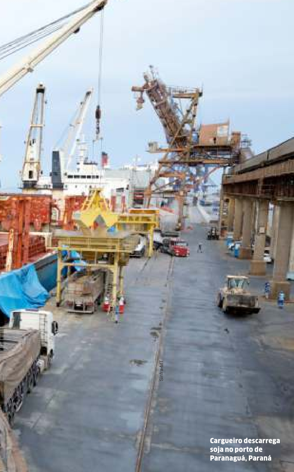
Cargueiro descarrega soja no porto de Paranaguá, Paraná

eficiência na operação”, disse o diretor.