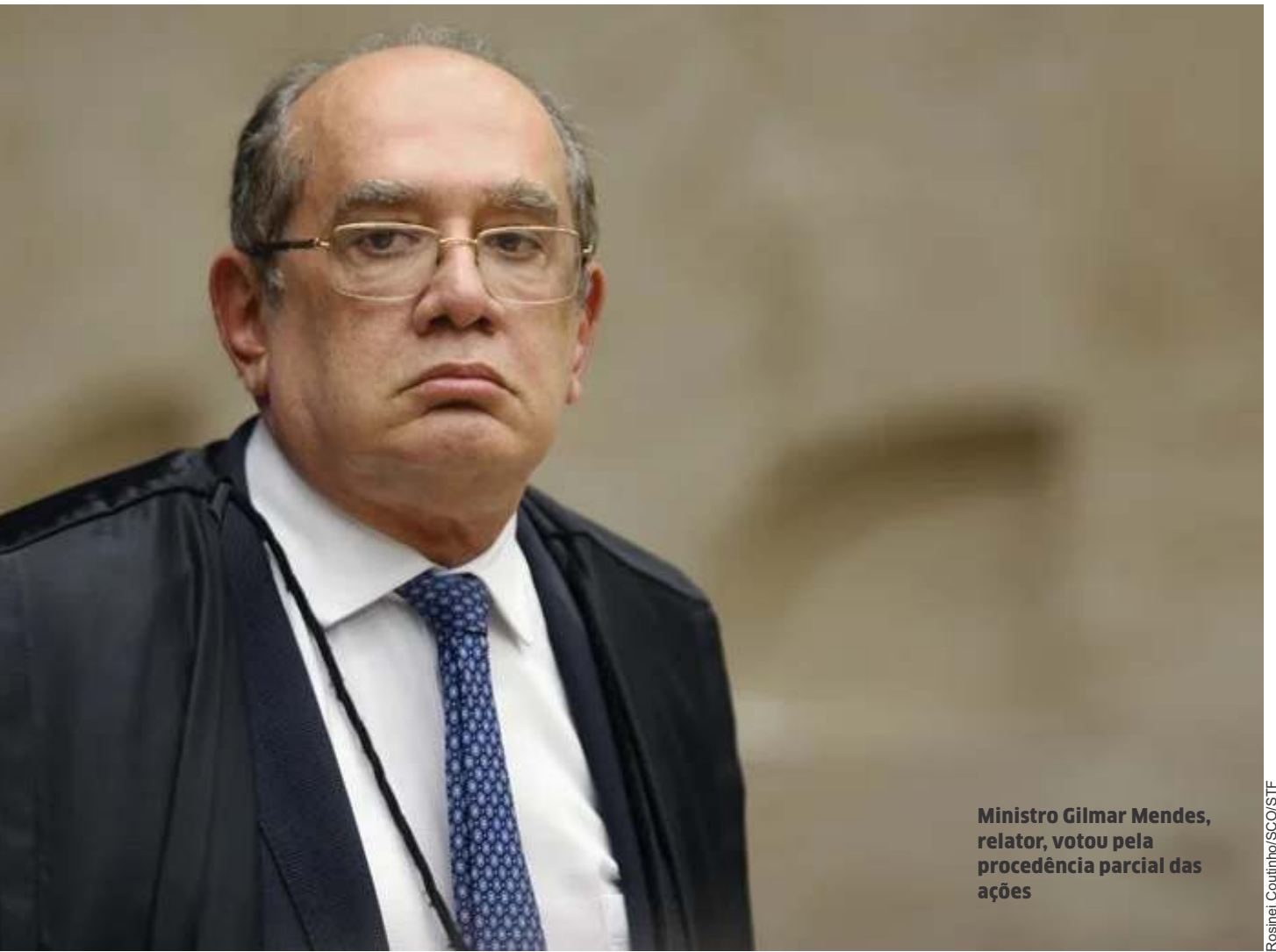
Ministro Gilmar Mendes, relator, votou pela procedência parcial das ações