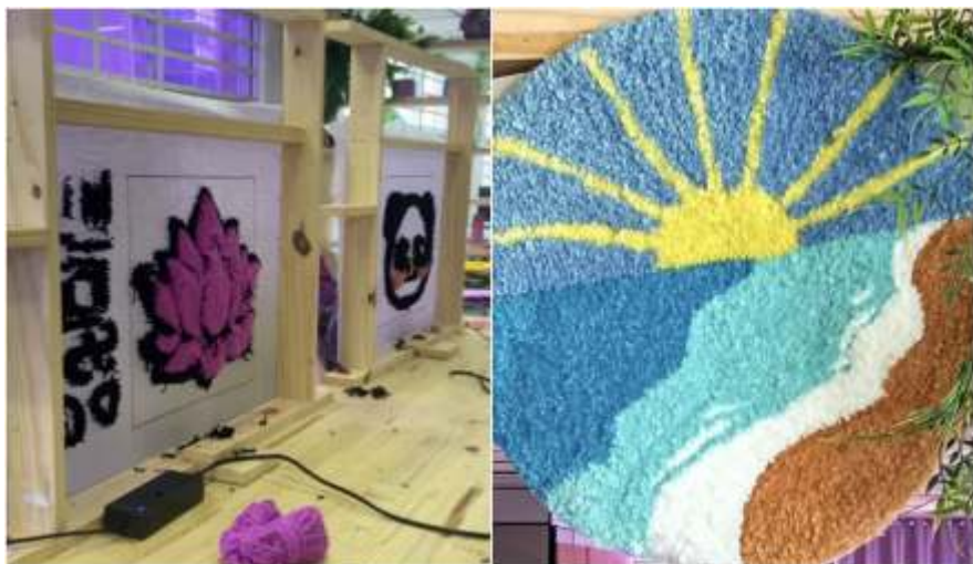
Tapete da RugLab

A empreendedora conta que, quando começou a aprender a fazer os tapetes, todo o conteúdo que consumia era internacional, já que a técnica era pouco conhecida no Brasil. "Eu fiquei meses assistindo aos vídeos até tomar coragem e comprar uma pistola para eu deixar de assistir e começar a fazer os tapetes em casa", diz