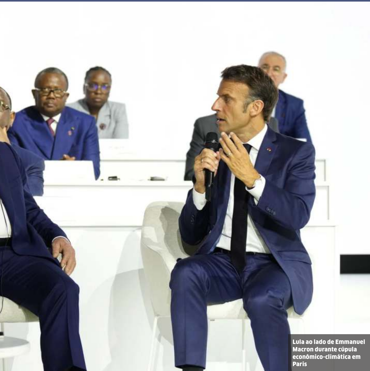
Lula ao lado de Emmanuel Macron durante cúpula econômico-climática em Paris