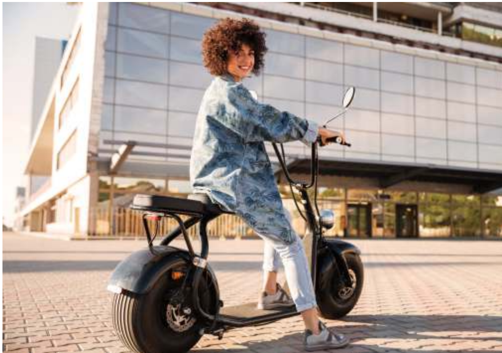
Com o aumento significativo desse tipo de veículo em circulação pelas cidades é necessário um regramento para o tráfego

A Confederação Nacional de Municípios (CNM) esclarece que ficará a cargo das secretarias responsáveis pela temática de trânsito, transporte e mobilidade dos Municípios proceder com a regulamentação dos ciclomotores, bicicletas elétricas e equipamentos de mobilidade individual autopropelidos, nas vias abertas à circulação pública sob sua circunscrição. A área técnica de Transporte e Mobilidade da CNM avalia que a resolução foi um instrumento importante para garantir a segurança